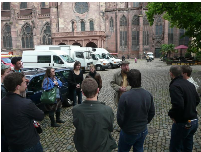
Die Gruppe bei der Begrüssung zur Stadttour durch unseren Tourenführer

Erste Station ist das Museum für Stadtgeschichte visavis vom Münster. Es befindet sich im spätbarocken Haus des Malers, Bildhauers und Architekten Johann Christian Wentzinger