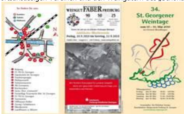
Flyer St. Georger Weintage

Nach einer gemütlichen Carfahrt mit DVD-Unterhaltung, kamen wir um die Mittagszeit in Freiburg im Breisgau bei unserer Jugendherberge an. Da unser Gruppenprogramm erst um 14.00 Uhr startete, beschlossen einige von uns bereits in die Stadt zu gehen. Wir genossen ein feines Wienerschnitzel, zu einem günstigen Preis. Bereits hier gab es auch schon die erste Erfahrung mit unserem Gruppenthema, da alle sich ein Bierchen gönnten. Die erste Station unseres offiziellen Programms sind die 34. St. Georger Weintage im Ortsteil Wendlingen in Freiburg. Das grösste Weinfest der Region findet jedes Jahr für drei Tage im Mai statt und bietet neben der Verkostung hiesiger Weine auch kulinarische badische Spezialitäten und diverse Unterhaltungsprogramme an. Organisiert wird das Fest von ortsansässigen Vereinen und den Weingütern des „Schönbergs“.