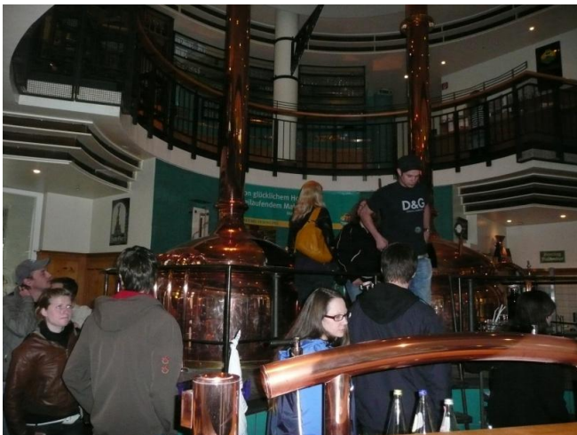
Der Ausschankbereich mit Kupferkesseln