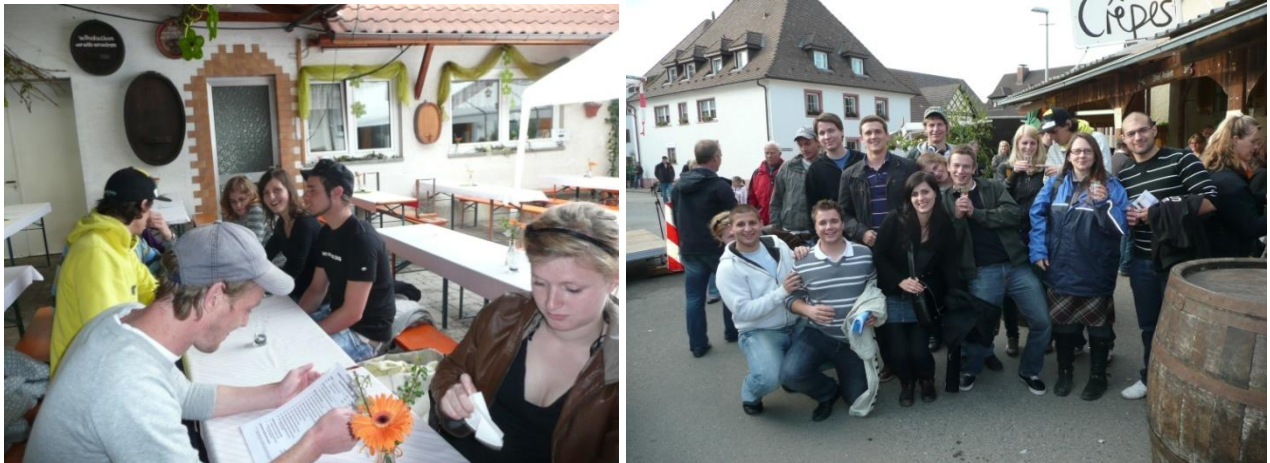
Im Degustationszelt der Winzerei „Faber“