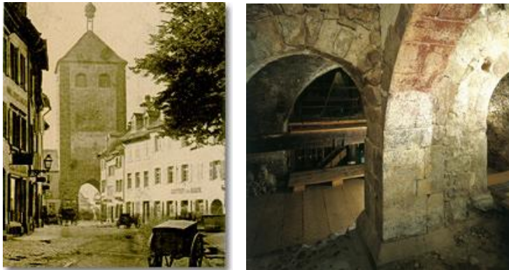
Der Weinkeller des Gasthofes zum roten Bären

Weiter geht es zu Deutschlands ältestem Gasthof dem „Roten Bären“ . Er gehört zu den ältesten Gebäuden in Freiburg. Der Weinkeller des Bären stammt sogar aus der Zeit vor der Stadtgründung 1120. Im dreistöckigen Keller mit seinen gewachsenen Böden, den Pfeilern und den Arkadenbögen degustieren wir einen Riesling des Hauses und lauschen weiter den Erzählungen des Stadtführers.