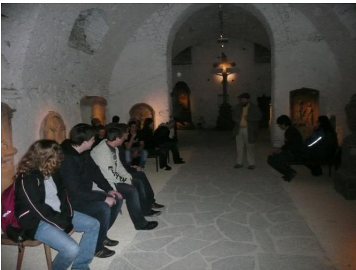
Die „Nonnengruft“ in der St. Ursula Kirche

Danach führt uns der Rundgang zur „Nonnengruft“ der alt-katholischen Kirche St. Ursula in der Rathausgasse.