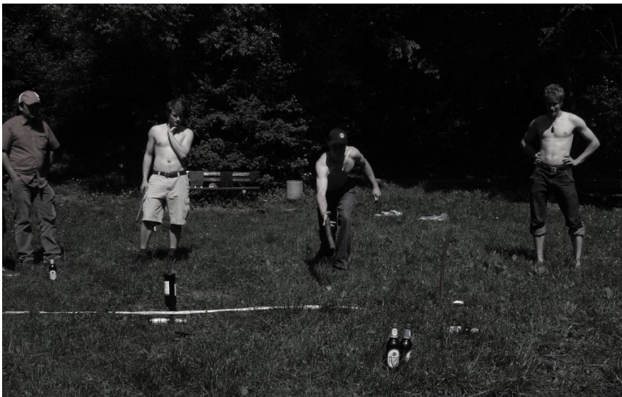
Am Cube spielen

Nach einer vergnüglichen Nacht ertüchtigten wir uns sportlich. Auf der grossen Wiese zwischen Bäumen spielten wir das eigenartige Spiel „Cube“. Da wir improvisieren mussten nahmen wir gewöhnliche Stöcke und PET-Bierflaschen die es galt umzuwerfen mit den Stöcken. Nicht nur ein sehr gemütliches Spiel, auch Ausdauer und Geschick war gefragt. Schlussendlich waren wir froh, dass es nach etwa drei Stunden endlich zu Ende ging und wir uns in die Grossstadt Heidelberg stürzen konnten.