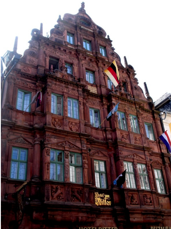
Das Hotel „Zum Ritter“, 1592 erbaut