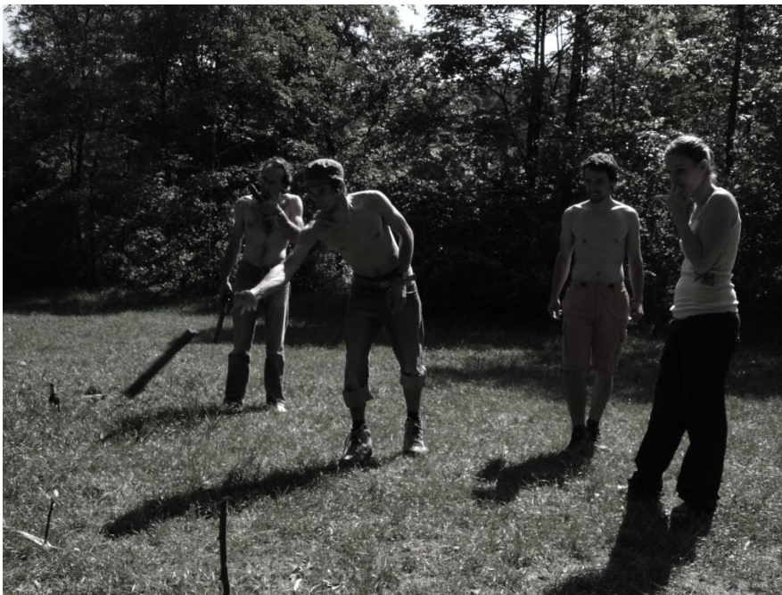
Am Cube spielen