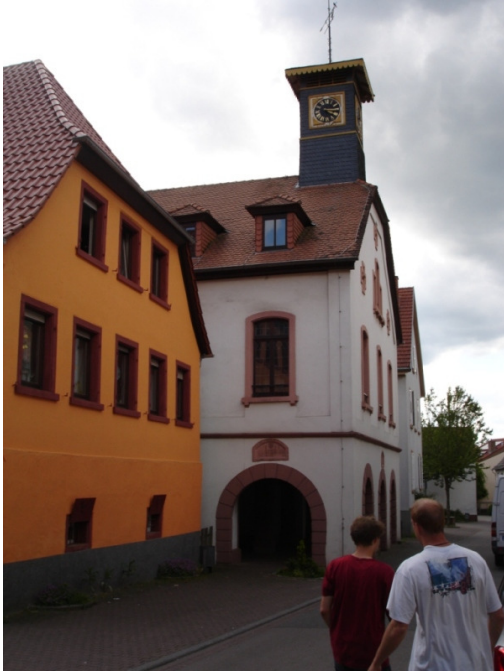
Hemsbach, Altes Rathaus