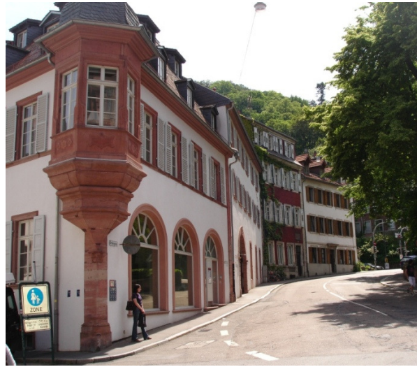
Altstadthäuser in Heidelberg