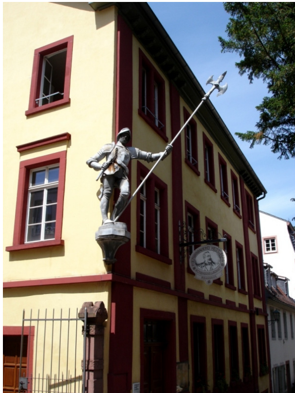
Ritterstatue in der Altstadt von Heidelberg