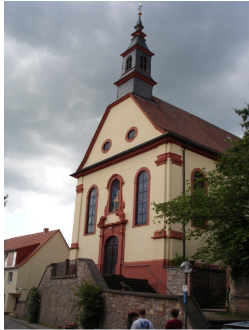
St.-Laurentius-Kirche von 1749